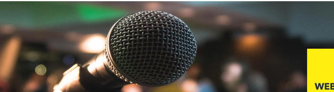
TABLE RONDE VIRTUELLE : quelle est la "boite à outils" de l'employeur confronté à la déloyauté d'un salarié ou d'un ancien salarié ?

Les entreprises et leurs dirigeants sont confrontés de manière récurrente à des actes de déloyauté de salariés ou d'anciens salariés qui détournent des clients, des savoir-faire et des fichiers au profit d'une activité concurrente, qui dénigrent leur ancien employeur ou débauchent du personnel .... Fragilisées par la crise sanitaire et ses impacts économiques, exposées à des difficultés de recrutement ... , les entreprises peuvent être encore plus vulnérables face à des comportements déloyaux.